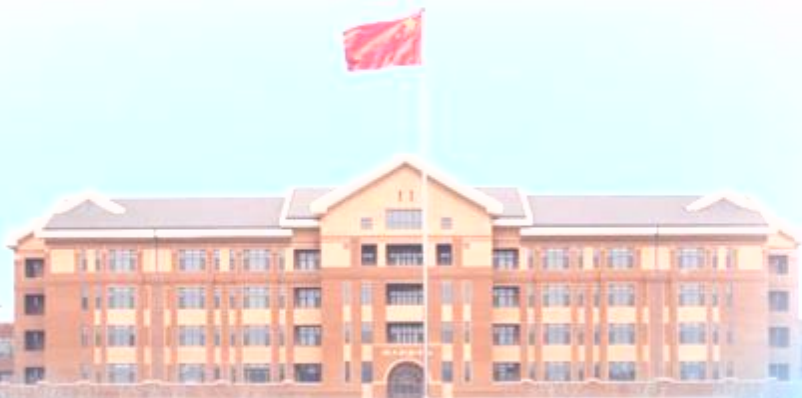
天津机电职业技术学院 TIANJIN VOCATIONAL COLLEGE OF MECHANICAL, ELECTRICAL, ELECTRONICS AND ELECTRICITY